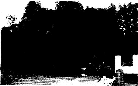
图1 江西省全南县陂头镇竹山村旁的1株古桂 Fig. 1 An ancient tree of Osmanthus fragrans (Thunb.) Lour. near Zhushan Village of Pitou Town in Quannan County of Jiangxi Province

在全南县的龙源坝镇、南迳镇和陂头镇等地均有古桂或古桂群存在,总计有80多株,多数生长于较偏远的村落、山坡或溪谷之中,长势茂盛,基本无病虫害。古桂以银桂( O. fragrans Albus Group)为主,叶片多数较平展,结籽与不结籽的植株均有,其中结籽的古桂比例约为15%。最大的1株古桂位于陂头镇竹山村旁(图1),据了解该古桂花色浅黄色,为银桂;该树长势良好,郁郁葱葱;冠型近球形,胸径约1.1 m,冠幅近280 m 2 ;有4个大分枝,每个大分枝又分出2个小分枝,每个小分枝直径约36 cm,如此体量,华东少见。