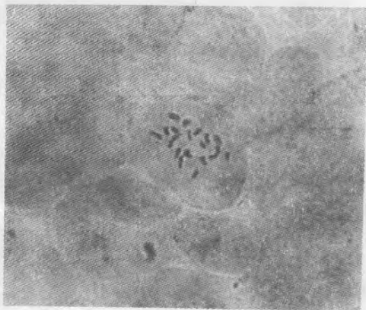
图1 黄芩二倍体染色体 2n=2x=18(\times 1600)

体。筛选出的多倍体可以立即应用组织培养技术在短期内迅速繁殖出大量的试管苗,以进行田间鉴定、生产试验和示范推广,而且繁殖出来的种苗纯度高、质量好,没有病虫害,这对提高植物的产量和质量十分有利。